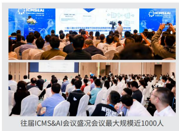
往届ICMS&AI会议盛况会议最大规模近1000人